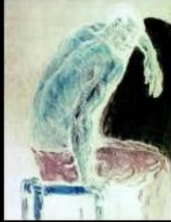
Dans la Solitude des champs de coton de Koltès, 2004