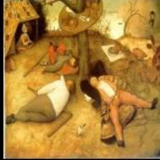
Le Pourpoint rétréci Farce Anonyme du XVIe,