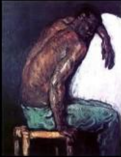
La Nuit juste avant les forêts de Koltès, 2003 2005

Fondée en 2007, pour la création de La Nuit Juste avant les Forêts et Dans la Solitude des Champs de Coton de B.M. Koltès, la compagnie le Pied et l' Oreille aujourd'hui devenue le Théâtre des Sens entame avec Elvire Matériaux et Quartett son 5 ème projet : Apocalypse Révolution .