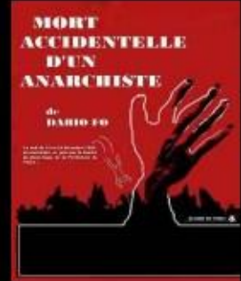
Mort Accidentelle d'un anarchiste 2004 de Dario Fo,

Le Théâtre des Sens est une structure de Laboratoire et de Création, ayant pour medium les mouvements du corps et de la voix.